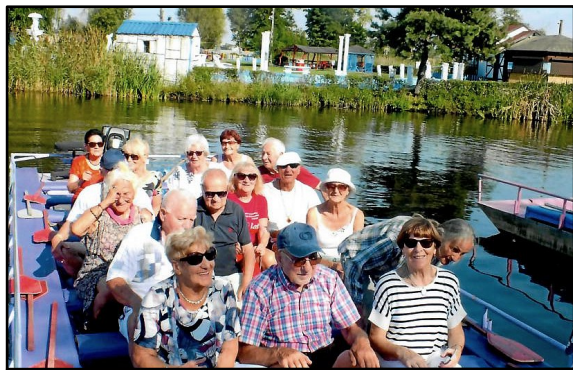
Piękny godzinny rejs łodzią po urokliwych kanałach międzystawowych koło hotelu.

Na drugi dzień po śniadaniu zwiedziliśmy