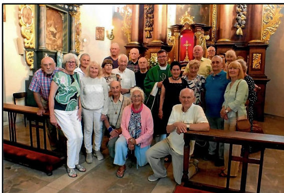
Radośni po Mszy Świętej w intencji naszego rocznika.